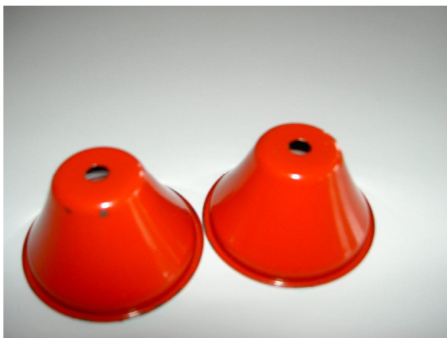
Illustrazione 1: Le campanelline